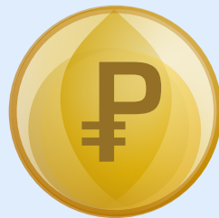
улучшение инвестиционного климата региона